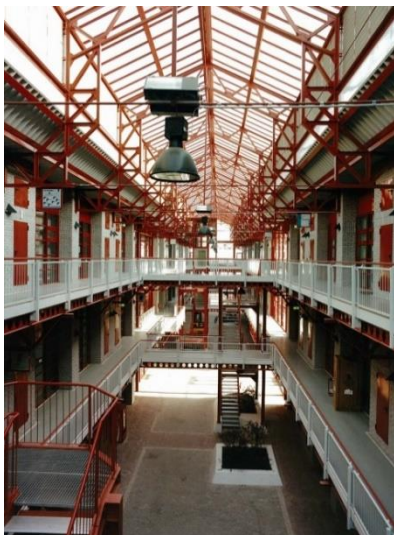
Blick in den Lichthof

Ob Büro, Werkstatt, Fertigungsfläche, Versuchsfeld oder Schulungsraum – das IGZ Magdeburg bietet innovativen Unternehmen aus nahezu allen Branchen gute Entfaltungsmöglichkeiten.