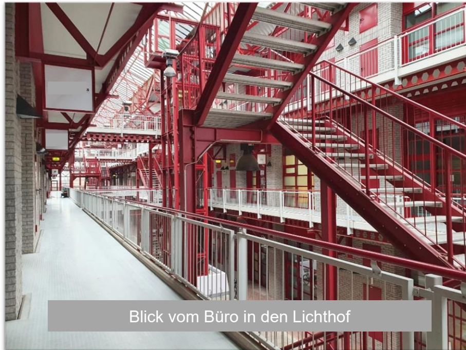
Blick vom Büro in den Lichthof